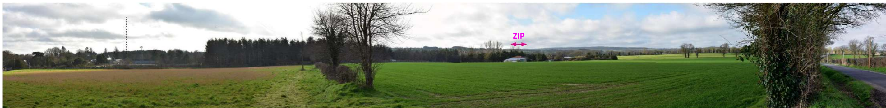
Photo 166 : Depuis les hauteurs à l'ouest du domaine de Tournelay (MH51) la ZIP est perceptible à l'horizon, mais reste peu prégnante