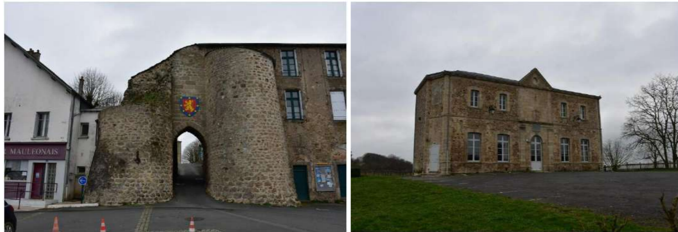
Photo 159 : Entrée de l'enceinte du château de Mauléon (MH33), et palais de justice construit au centre de l'enceinte au XVIII ème siècle

Le château est implanté sur une butte (175 m), et le vallon du Jouin offre une perspective ouverte vers le sud-est : depuis l'enceinte fortifiée, aménagée en terrasse jardinée, des visibilitées partielles de la ZIP sont possibles par-dessus le tissu bâti, atténuées par la distance (13,8 km) et la végétation. La sensibilité est faible.