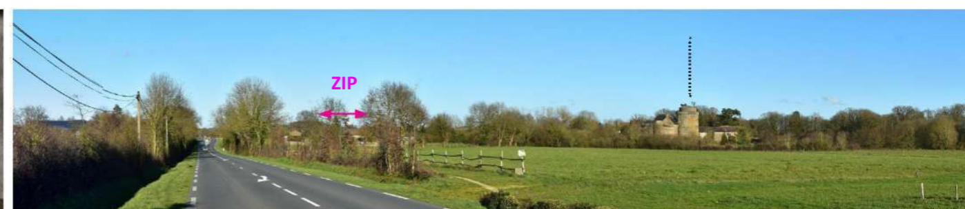
Photo 164 : Depuis la D960b à l'est de St-Mesmin, une covisibilité peu marquante existe entre la ZIP et le château de St-Mesmin (MH45)