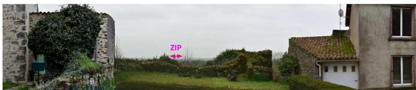
Photo 163 : Autour du donjon de Châteaumur (MH17), quelques ouvertures dans l'enceinte bâtie offrent des vues sur les alentours