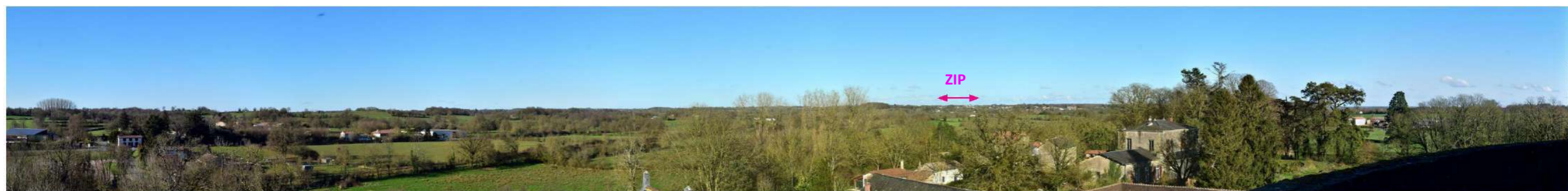
Photo 165 : Le donjon du château de St-Mesmin (MH45) offre un panorama très généreux sur le paysage ; la ZIP y est assez visible à l'horizon