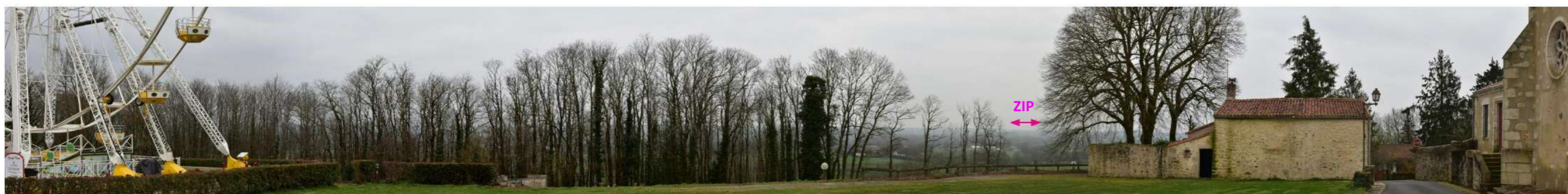
Photo 161 : Depuis la butte de Châtelliers, le relief permet des vues lointaines, largement filtrées par la végétation ; la ZIP est ici perceptible entre ces écrans, depuis les abords de l'église Notre Dame (MH21)