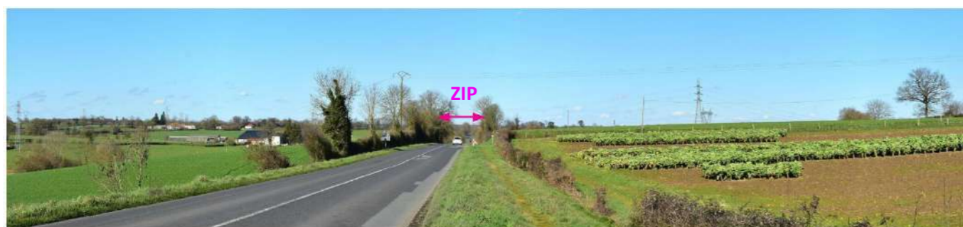
Photo 152 : Depuis la D938ter à St-Marsault, la ZIP s'inscrit dans l'axe de la voie

Depuis St-Pierre-du-Chemin, en limite sud-ouest de l'AEE, les premiers kilomètres n'offrent aucune visibilité sur la ZIP, masquée par la végétation dense (aux abords de la route ou en arrière-plan). Mais celle-ci se révèle partiellement sur un long tronçon au sud de La Forêt-sur-Sèvre, du fait de l'orientation de la voie, axée vers la ZIP. Seules les parties les plus hautes en sont néanmoins perceptibles, du fait de la végétation distante. Juste avant l'AER des ouvertures visuelles plus franches se révèlent, au franchissement du coteau de la Sèvre Nantaise. En arrivant de l'est de l'AEE, quelques perceptions partielles sont possibles de façon ponctuelle : aux abords de Noirterre, et à l'approche du contournement de Bressuire. Ces visibilitées de la ZIP restent très peu marquantes au vu de la distance et des filtres végétaux. Sur le reste du parcours, les haies aux abords de la voie referment le plus souvent les vues. La sensibilité est très faible.