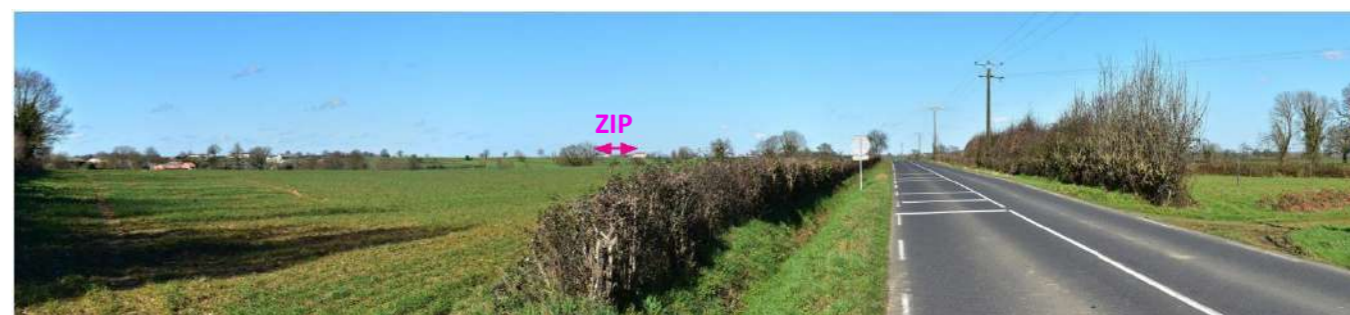
Photo 153 : Depuis Chantemerle au sud de l'AEE, la D744 permet d'apercevoir la ZIP, peu marquante dans le lointain

Depuis la limite sud de l'AEE et jusqu'à l'AER, cette route dessert les bourgs de Moncutant et La Forêt-sur-Sèvre. La végétation est bien présente aux abords de la route, et les perceptions de la ZIP restent très ponctuelles et partielles, seules ses parties les plus hautes émergeant alors à l'horizon. De St-Pierre-des-Échaubrognes, en limite nord-ouest de l'AEE, jusqu'à Mauléon, quelques perceptions de la ZIP sont possibles depuis la D41, mais elles restent très ponctuelles et peu marquantes, du fait de la distance et de la végétation. De même, la D744 entre Mauléon et l'AER offre très peu de perceptions vers la ZIP, notamment du fait de la présence de végétation aux abords directs de la route : les visibilitées restent là aussi ponctuelles et partielles. La sensibilité est très faible.