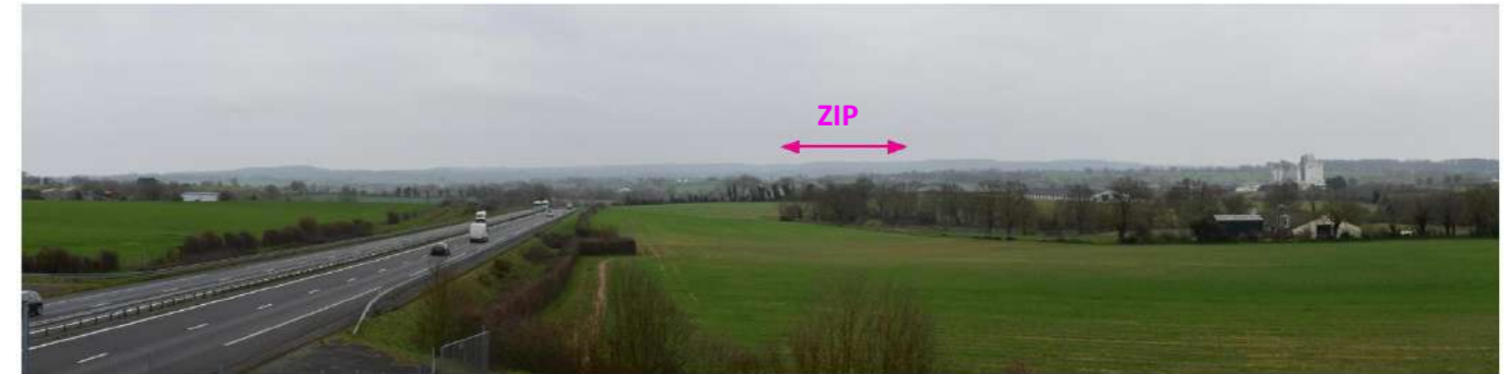
Photo 149 : Perception en direction de la ZIP depuis la N249 à l'est de Mauléon

Cette route départementale relie Bressuire à Cholet, à une dizaine de kilomètres au nord-ouest de l'AEE, et constitue un axe de communication majeur. Depuis le nord-ouest en direction de Bressuire, le trajet est tout d'abord cadré par la présence de talus souvent végétalisés, qui referment les perceptions. Après avoir croisé la D759, à l'est de Mauléon, les visibilitées s'ouvrent vers le sud-est, en direction de la ZIP, qui apparaît souvent dans l'axe de la route. Néanmoins, la distance et la végétation réduisent nettement sa prégnance visuelle. La sensibilité est très faible.