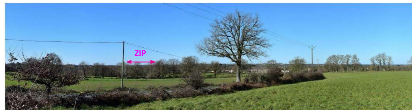
Photo 154 : Depuis la D748 à proximité de l'AER, la végétation filtre assez largement la ZIP

Depuis cette route reliant La Chapelle-St-Laurent à Bressuire, très peu de perceptions en direction de la ZIP sont possibles. Seul un tronçon de quelques kilomètres, à l'approche de l'AER, est concerné par des visibilitées ponctuelles de la ZIP, qui restent très partielles du fait de la végétation (seules les parties les plus hautes sont en général visibles). La sensibilité est très faible.