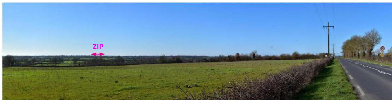
Photo 151 : Depuis la N149, à l'est de St-Sauveur de Givre en Mai, la ZIP est masquée par la végétation

Cette route permet de relier Mauléon à Argenton-les-Vallées, puis Thouars, à une quinzaine de kilomètres à l'est de l'AEE. Les visibilitées de la ZIP sont rares sur cette route : si les vues s'ouvrent vers le sud dans certains secteurs, la végétation distante suffit en général à la masquer totalement. Depuis quelques tronçons, des vues partielles lointaines sont néanmoins possibles, par intermittence (notamment aux abords de Nueil-les-Aubiers) : ces perceptions restent assez fugaces, et se résument aux parties les plus hautes de la ZIP. Entre Argenton-les-Vallées et Nueil-les-Aubiers, un tronçon de moins de 3 km offre des vues lointaines et continues vers le sud, au-delà de la vallée de l'Argent, mais la ZIP reste lointaine et peu marquante à l'horizon. La sensibilité est très faible.