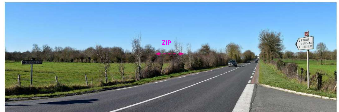
Photo 150 : Depuis la D759, à l'ouest d'Argenton-les-Vallées, la ZIP est visible mais peu marquante

Plus ou moins parallèle à la précédente, cette voie relie Mortagne-sur-Sèvre, à 11 km environ au nord-ouest de l'AEE, à Parthenay, à 15 km au sud-est. Entre Mauléon et Bressuire, son importance est secondaire : elle a été remplacée par la N249. En limite ouest de l'AEE, des vues très partielles, lointaines et intermittentes sont possibles, à peine plus marquées en lisière du bois de la Blandinière ; les reliefs de la vallée de l'Ouin empêchent ensuite toute perception. Depuis le sud-est, la végétation empêche toute perception de la ZIP ; ce n'est qu'aux abords de Bressuire que de courts tronçons du contournement routier offrent des visibilitées dans sa direction. La sensibilité est très faible.