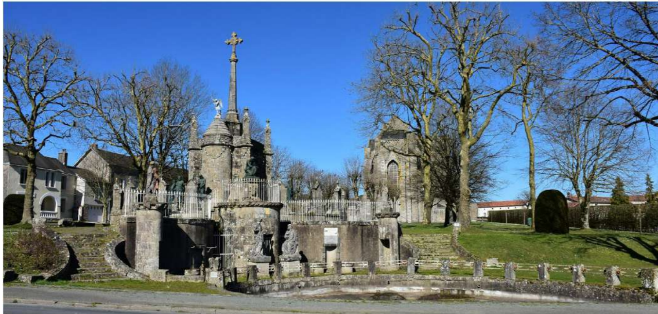
Photo 157 : Eglise Notre-Dame de Pitié (MH23), et son calvaire en avant-plan

Cette basilique constitue un ensemble architectural monumental, typique de l'architecture néo-gothique ; l'absence de la flèche initialement prévue est également notable. L'église s'accompagne en outre d'un calvaire monumental, doté d'une chapelle et de sept fontaines. Des pèlerinages importants contribuent également à la renommée de ce monument. L'enjeu est fort.