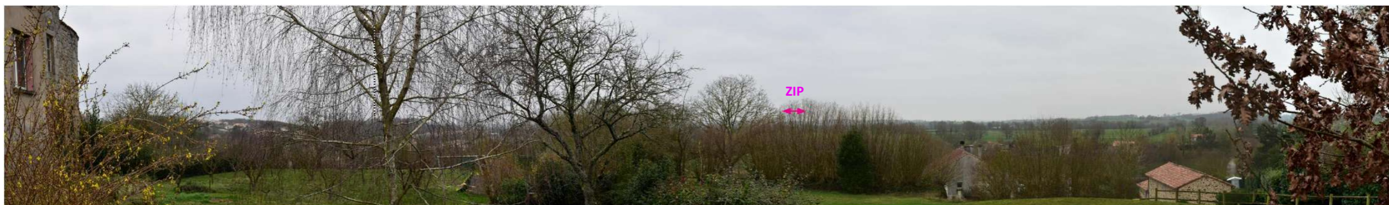
Photo 160 : Depuis le chemin d'accès au donjon de Châteaumur (MH17), la végétation filtre les perceptions, notamment vers la ZIP et l'église Notre Dame des Châtelliers (MH21)