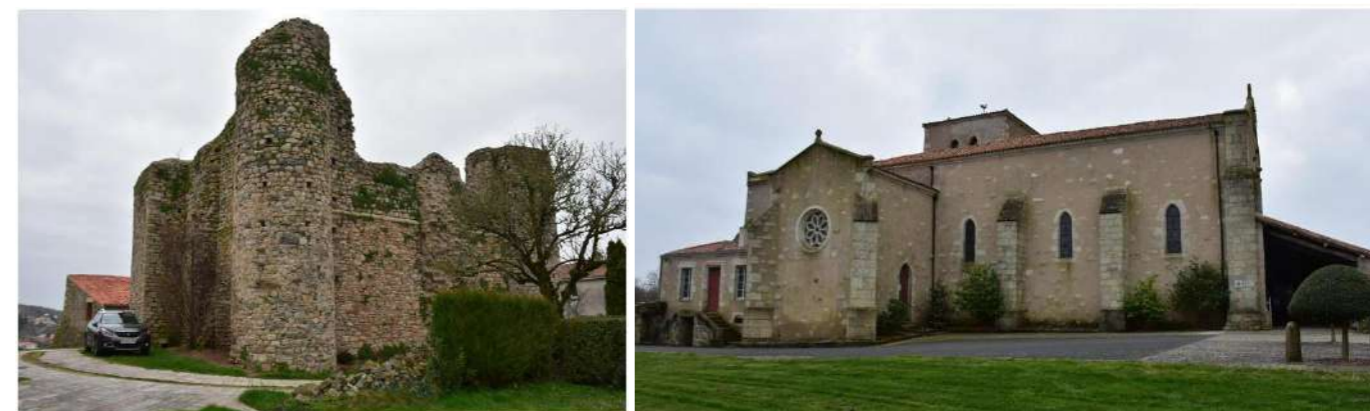
Photo 156 : Donjon de Châteaumur (MH17) et Notre Dame des Châtelliers (MH21)

Du fait de cette implantation sur une butte, les abords de l'édifice permettent des visibilitées en direction de la ZIP, par-delà la vallée de la Sèvre Nantaise à l'est. Au vu de la distance importante les séparant (16,4 km), la prégnance visuelle de la ZIP à l'horizon reste très réduite. Une covisibilité, également peu marquante, est possible depuis le donjon de Châteaumur, à l'ouest. La sensibilité est faible.